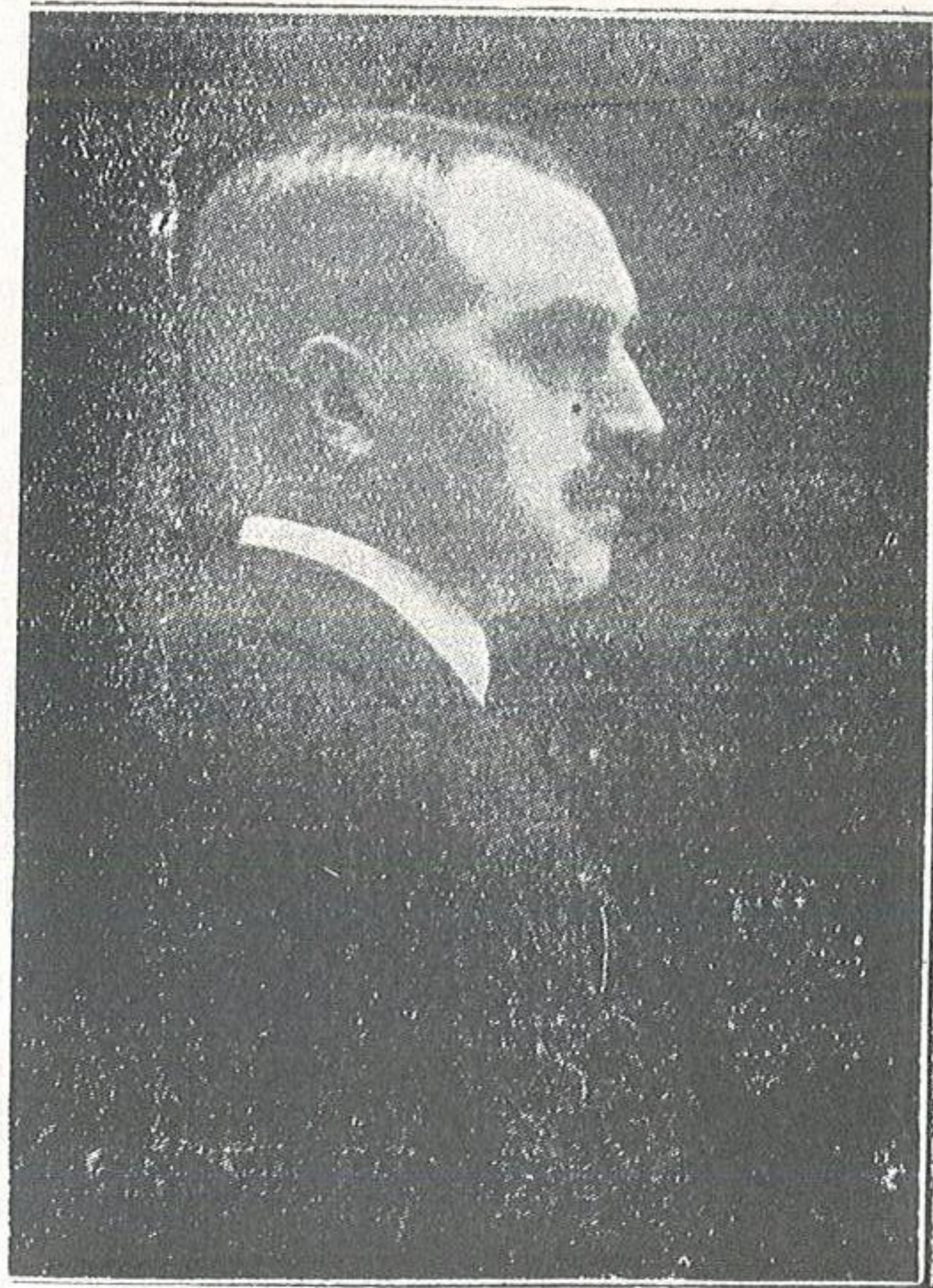
المستشرق الاسباني الدكتور خوان برنيت